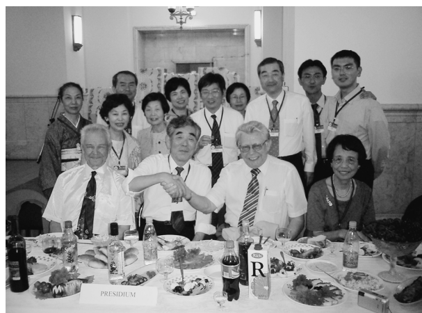
写真3 レセプションでZolotov教授(前列左)とMyasoedov教授(前列右から2番目)を囲んでの日本人参加者の記念写真

PL9. A. Manz (ドイツ): Continuous-flow focusing and separations on chip.